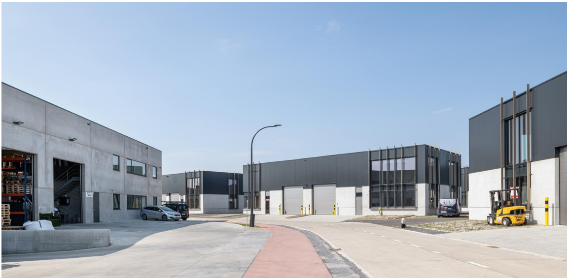
Opwijk – De Vlaamse Staak

De tweede fase start na de resultaten van het innovatieproject ROLECS. Het ROLECS-project (Roll-out of Local Energy Communities) is een FLUX50-VLAIO-gesubsidieerd onderzoeksproject, dat de stukken levert die nodig zijn om het energielandschap vooruit te helpen in lijn met het nieuw wetgevend kader van de Europese Commissie rond 'The Clean Energy for All Europeans package': duurzamer en actiever participeren van de eindconsument. CPE zal dan nagaan of er een business case kan opgemaakt worden voor het uitrollen van een Local Energy Community (LEC) en met bijkomende lokale hernieuwbare energieopwekking door middel van een middelgrote windturbine en/of bijkomende zonnepanelen.