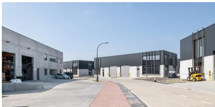
Bedrijven - De Vlaamse Staak – Opwijk

De Vlaamse Staak – een samenwerking tussen POM Vlaams-Brabant, gemeente Opwijk en Haviland intercommunale – is een nieuw future proof lokaal bedrijventerrein met moderne infrastructuur. Mede dankzij ondersteuning van Vlaanderen, is de Vlaamse Staak volmondig een duurzaam, innovatief en toekomstgericht bedrijventerrein te noemen, waarbij de energievoorziening op een duurzame manier gebeurt via lokale energieopwekking en lokaal gebruik.