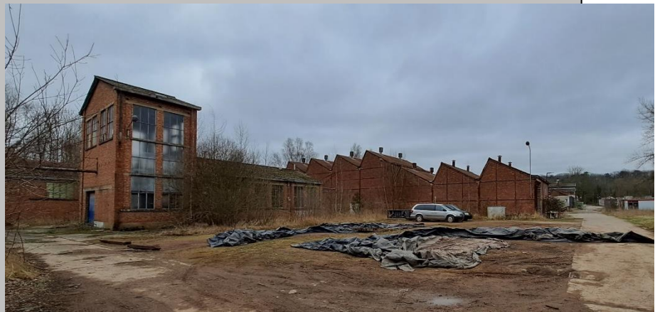
Huldenberg - Florivalstraat