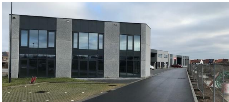
3 Tommen – Tienen

Op de ruime groenzone werd ook in 2022 door POM Vlaams-Brabant met een gefaseerd maaibeheer ingezet op biodiversiteit.