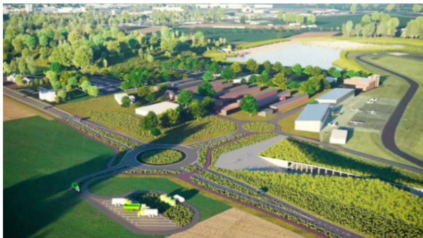
Project - Tiense Watervelden

POM Vlaams-Brabant bood in 2022 hoofdzakelijk bij opmaak van het businessplan voor het project. Naast het businessplan bestaat het project uit een complex geheel van onder meer de technische specificaties van de waterbekkens en -behandeling, de grondverwervingen, het planproces, het vergunningentraject en een exploitatiemodel voor een recreatief medegebruik.