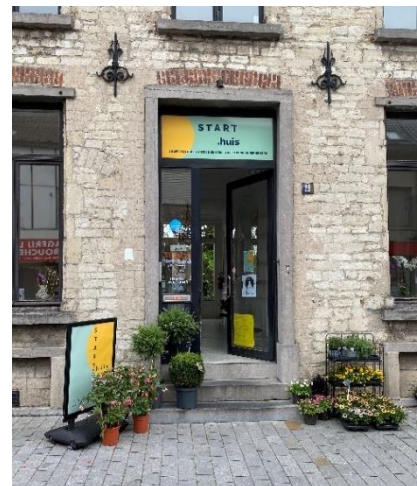
Ortshuis – Vilvoorde