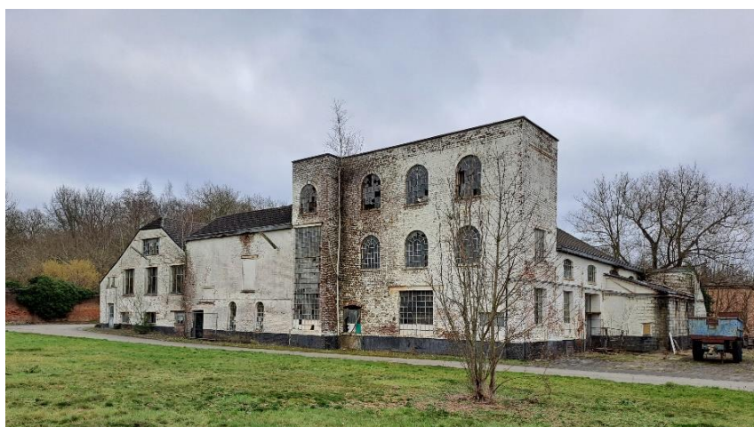
Huldenberg - Florivalstraat

Tot slot werd in 2022 heel wat actie ondernomen m.b.t. de problematiek van de 'grijze' economie en de illegale bezetters op de site, met als doel deze zo snel als mogelijk van de site te weren. Enkel op deze manier kan de veiligheid op en rond de site worden gegarandeerd, wordt nieuwe vervuiling/sluikstorten op de site tegengaan en worden ondermijnende criminele activiteiten op de site onmogelijk gemaakt. Dit vergt heel wat coördinatie gezien de ligging op de twee gewesten (twee bevoegde politiezones, twee gerechtelijke arrondissementen, etc.) Na een gecoördineerde actie in november 2022 werd de site opnieuw afgesloten, waardoor deze enkel nog toegankelijk is voor de rechtmatige bezetters. Er werd eveneens een conciërge-overeenkomst afgesloten met één van de rechtmatige bezetters; zodat enerzijds sociale controle gewaarborgd is en anderzijds een zeker onderhoud op en rond de site wordt verzekerd.