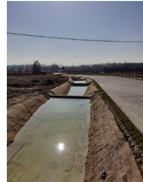
Ternat Afrit 20