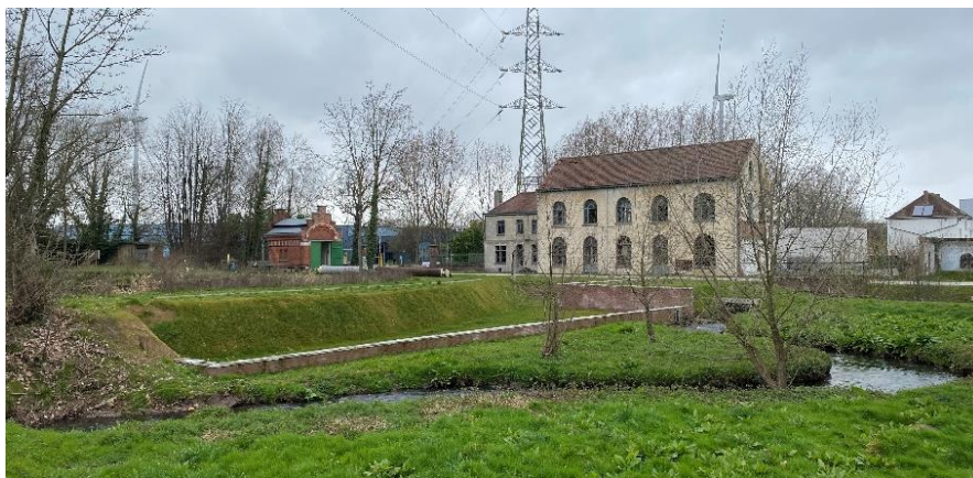
Manchestersite - Beersel

POM werkt vanuit zijn historische vertrouwdheid en betrokkenheid met de omgeving ook actief mee met de provincie in kader van het strategisch project Zennevallei. Voor de omgeving van Park Neerdorp wordt verder gezocht naar maatregelen in kader van de beheersing van de overstromingsproblematiek van de Molenbeek en haar impact op de omgevende bedrijvzones.