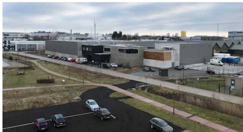
Marma - Tienen

Op de terreinen van de FFH-campus zet POM Vlaams-Brabant volop in op bio diverse, groene infrastructuur, die aansluit bij zijn omgeving.