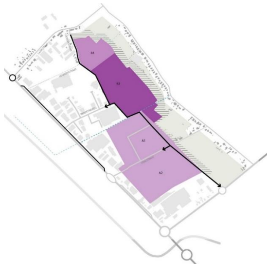
Kampenhout - Boortmeerbeek

Aanvankelijk werd enkel gekeken naar de ontwikkeling van de zone B1 bestemd voor lokale bedrijvigheid. In de loop van het traject werd echter ook de zone B2 mee opgenomen. Dit vooral omwille van de eigenheid van het PRUP, waardoor de realisatie van de totale ontsluitingsinfrastructuur richting de ketelrotonde op de Haachtsesteenweg noodzakelijk is. De nieuwe ontsluitingsweg zal volgens het huidige voorliggende ontwerp de zone B2 aansnijden en loopt langs de zones A1 (reeds ontwikkeld door Haviland) en A2 (de braakliggende oude Covee-zone).