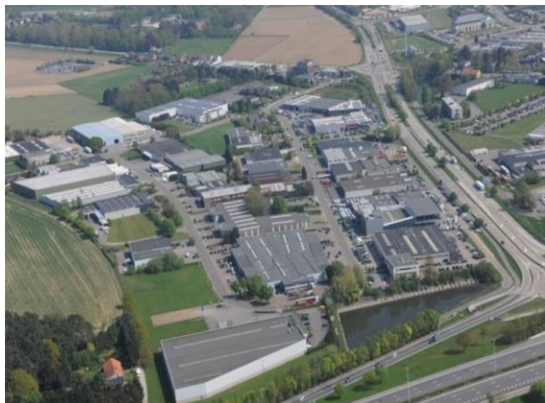
Ambachtelijke zone - Haasrode

Daarnaast werd er vanuit de POM ook nog het licht op groen gezet voor doorverkopen op de zone van 'Katvin/Lacom' aan 'Zzoomer' en van 'Philwooddesign' aan 'C units'.