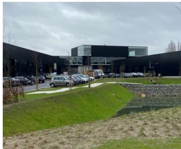
Steen III – Steenokkerzeel

Ondertussen werd het parkmanagement overgedragen aan een syndicus die de vereniging van mede-eigenaars aanstuurt.