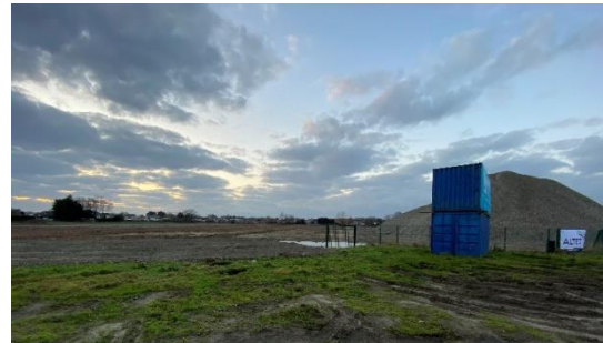
Afbraakwerken Stone-site - Londerzeel