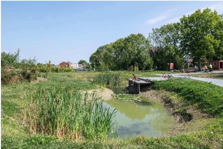
Bufferzone - De Vlaamse Staak – Opwijk

De ambitie tot de oprichting van een LEC (Local Energy Community) waarbij de bedrijven onderling energie kunnen delen, kan (nog) niet worden waargemaakt wegens gebrek aan een passend wettelijk kader. De actualiteit hieromtrent wordt op de voet gevolgd.