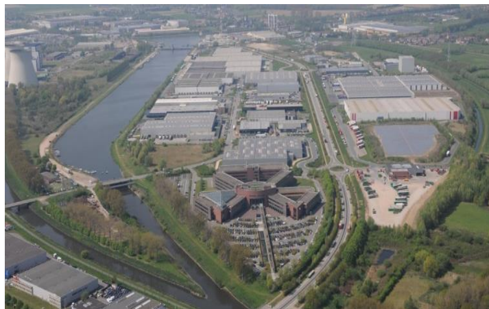
Businesspark Cargovil - Vilvoorde

Cargovil is een zone van 72 ha in Vilvoorde die door een beslissing van de Vlaamse regering werd ontwikkeld door de nv Novovil in de vroege jaren '90. Die besteedde de praktische aspecten van de realisatie uit aan de GOM Vlaams-Brabant, later overgenomen door de POM.