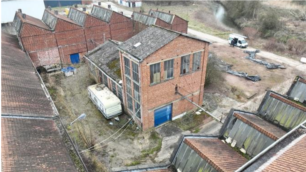
Huldenberg - Florivalstraat

Voor de POM is dit een grootschalig complex project dat zowel inhoudelijk als financieel veel uitdagingen stelt en de komende jaren veel inspanningen zal blijven vergen. Maar de intentie en de ambitie is er om dit project samen met de partners langs beide kanten van de gewestgrens aan te pakken en te komen tot een duurzame ontwikkeling op alle vlakken: ecologisch verantwoord en toekomstgericht en dit binnen een financieel haalbaar kader.