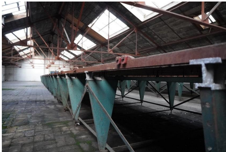
FobruX-site - Vilvoorde

In 2018 werd POM eigenaar van een deel van de voormalige fabrieken FobruX, die het hart vormen van de wijk Buda, ingesloten tussen Zenne, Budasteenweg, Schaarbeeklei en Brentastraat, om van hieruit te werken aan de heropleving van de buurt. Gelegen in het zuiden van Vilvoorde, tegen de grens met Brussel, heeft deze wijk nog haar authentieke industriële configuratie, maar draagt ze ook alle tekenen van het verval dat het industriële weefsel heeft gekend.