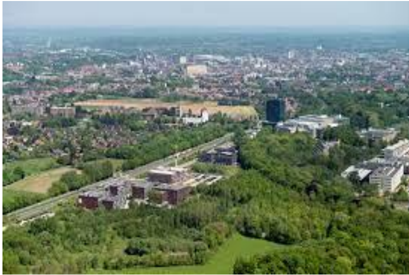
Luchtfoto Wetenschapspark Arenberg